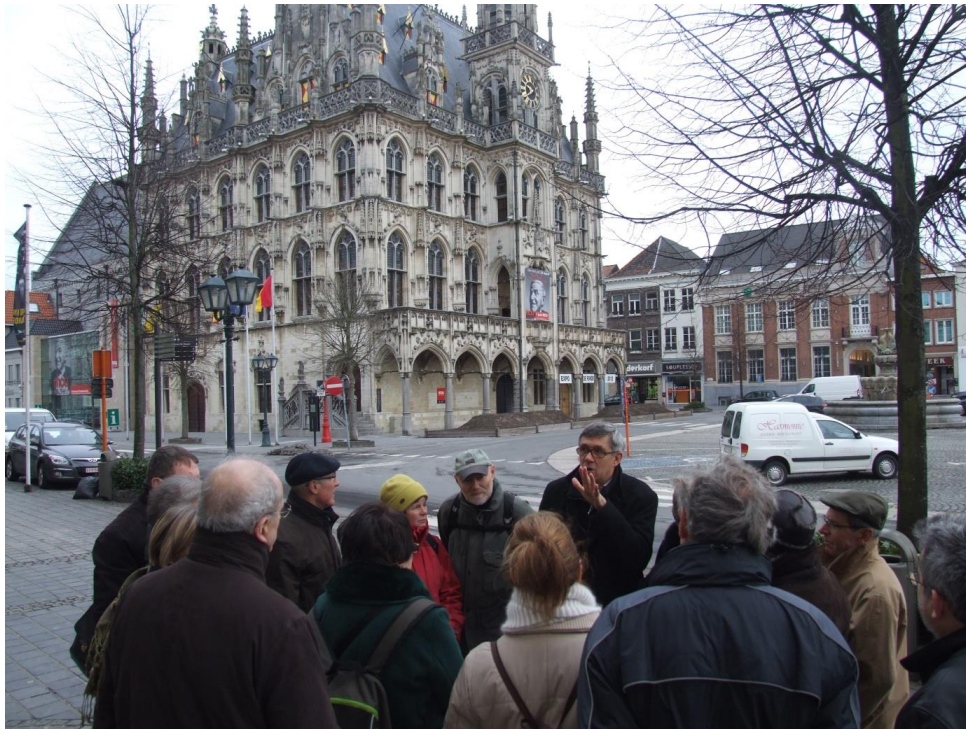
Stadsrondleiding met gids in Oudenaarde (foto Herbert Smitz).