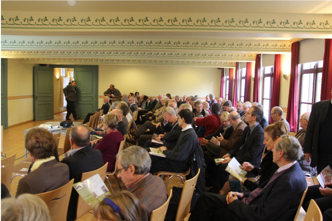
Voorstelling Annalen , deel 116, in kasteel Walburg.