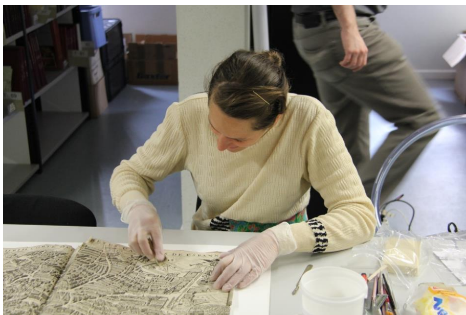
Restauratie van een oude kaart door Hannelore Mattheus.